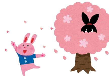
「アクセス通信」はメンバーさんみんなで作っています。興味のある方は、「アクセス通信編集日」には是非ご参加下さい

桜が咲くと春本番です。お花見がてらお散歩に行くのも良い季節です。今年はお幣局の通り抜けも久しぶりにあるそうです。申し込みが必要ですが。春を楽しみたいです。