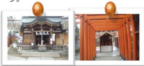
詳細はポスターにて

25日(金)お散歩に行きます。 行き先はまだ決まっていません。 メンバーミーティングで決ま ります。