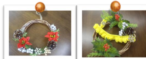
クリスマスリースです♪

2月の創作活動のテーマはまだ決まっていません。1月最後の創作活動で決めます。分室のポスターで確認してください。