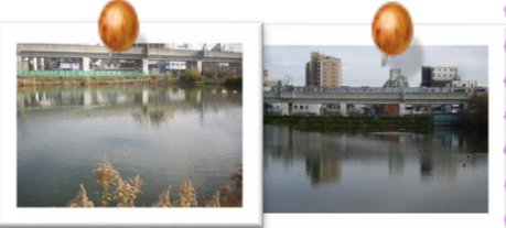
詳細はポスターにて

25日(金)お散歩に行きます。行先はまだ決まっていません。メンバーミーティングで決めます。