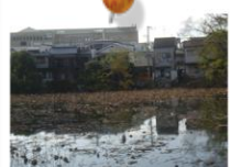
詳細はポスターにて