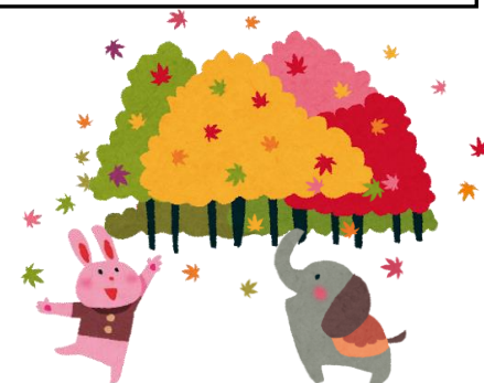
「アクセス通信」はメンバーさんみんなで作っています。 興味のある方は、「アクセス通信編集日」に是非ご参加下さい

焼き芋や栗ご飯も食べたいし、 紅葉も見に行きたいし、忙しい秋になりそうです。 今月もよろしくお願いします♪