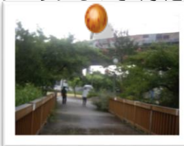
詳細はポスターにて

26日(金)にお散歩に行きます。 「あべのベルタでウィンドウショッピング」です。古本屋やリサイクルショップものぞく予定。