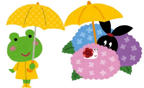
「アクセス通信」はメンバーさんみんなで作っています。 興味のある方は、「アクセス通信編集日」に是非ご参加下さい

6月ですね♪ 梅雨に入りジメジメしていますが、紫陽花が咲いていますね。 カタツムリやなめくじなど ゆっくり動く生き物を見るのも 楽しいかもしれません。