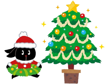
「アクセス通信」はメンバーさんみんなで作っています。興味のある方は、「アクセス通信編集日」に是非ご参加下さい