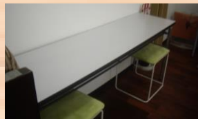
座れる場所も少し増えました♪

現在分室では、ソーシャルディスタンスを保ちながら活動出来るように少しレイアウト変更を行いました！！