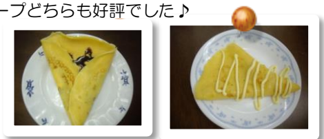
生クリームチョコ&ハムマヨ♪

スタッフ2名・メンバーさん4名での開催となりました♪今回は久しぶりの『クレープ』に挑戦しました♪甘いクレープとおかずクレープどちらも好評でした♪