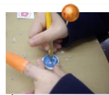
可愛いハンコが出来ました♪

「消しゴムはんこで年賀状をつくろう」という事でみんなで消しゴムのはんこを彫りました。かわいいはんこができあがりました。