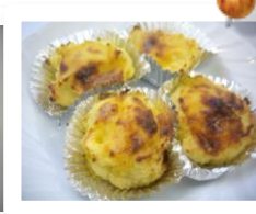
ほくほくスイートポテト