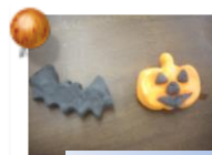
マグネットやカード♪

今回は『ハロウィンのマグネット作り』に挑戦しました！初の粘土やニスを使用し可愛い作品できました！沢山の参加でにぎわいました♪