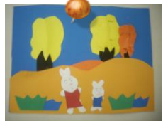
9月の秋をテーマに自由創作

毎月、切り絵やペーパークラフト・折り紙・スクラッチアートなどを挑戦しています♪人気プログラムになっています!