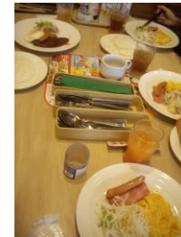
先月はガストでモーニングでした♪

色んな種類のモーニングがあり、楽しく選び、美味しく頂きました。話題も豊富で楽しいひとときになりました♪