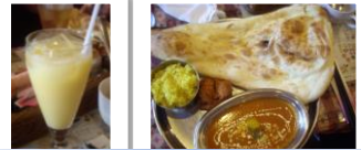
先月はインドカレーを食べました♪

今回は、近場のガストにモーニングを食べに行く企画になりました♪詳細はポスターにて!