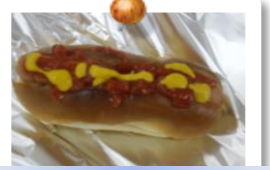
8月のホットドッグ♪