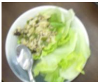
5月のレタスの肉みそ炒め

ヘルシークッキングでは、栄養士さんをお招きして、ヘルシーな美味しいランチを作っています!! 詳細は掲示されているポスターを御覧ください!