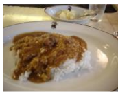
インディアンカレー

前回大好評♪だった企画『インディアンカレーを食べに行こう!!』の第2弾を行う事になりました♪